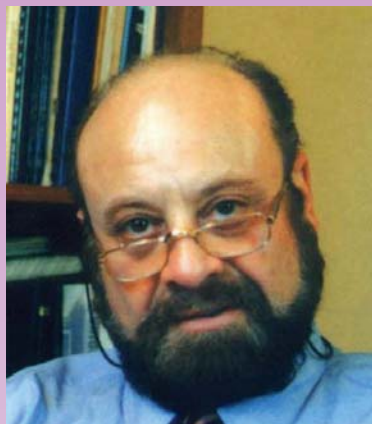
פרופ' רפי קרוסו מנהל אקדמי